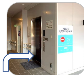
② アイソ薬局様入口向かいエレベーターはこちらです