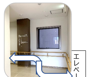
③ エレベーター出口右折～左折